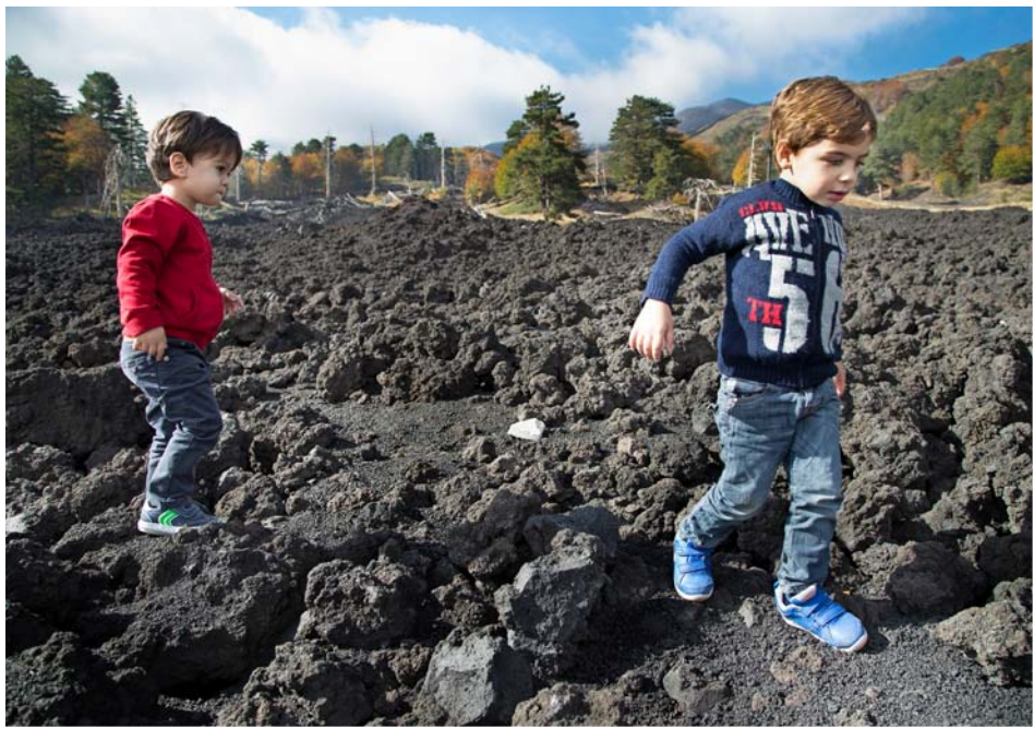
Camminare sui blocchi di lava è come un gioco: chi cade per primo perde! Mentre chi avvista uno degli animali nominati dalla guida (volpi, lepri, poiane, falchi) vince il primo premio...

Via Mareneve sale da Linguaglossa , a una quarantina di chilometri da Catania, lungo il versante settentrionale dell'Etna fino a Piano Provenzana , da dove prendono avvio le escursioni sul vulcano attivo più alto d'Europa. Il nome la dice lunga: si sale dal mar Ionio ai 1.800 metri, dove in inverno è attiva una stazione sciistica e dalla primavera si percorrono a piedi e in fuoristrada le sterrate e i sentieri sulle colate laviche storiche e recenti del vulcano, che domina ogni scenario del catanese e condiziona la vita dei suoi abitanti. A 550 metri di altitudine alle pendici dell'Etna, disposta su sette colate laviche sovrapposte, Linguaglossa è un'ottima base di partenza per esplorare il territorio: 18 chilometri per salire a Piano Provenzano e 18 per scendere a Fiumefreddo : dal vulcano al mare, ecco 36 chilometri che valgono il viaggio. Se la Supermaratona 0-3.000, che si tiene ogni anno in giugno (il 10 l'undicesima edizione), non è per tutti, le camminate sulla sabbia lavica sono adatte anche ai bambini e per salire ai crateri sommitali si viaggia in jeep con le guide autorizzate (info: tel. 095 7774502). Il periodo ideale per l'escursione è maggio-giugno, dopo il disgelo e prima della calura estiva. Per raggiungere il «deserto lavico», da Linguaglossa si attraversa in automobile una terra fertilissima di oliveti, vigneti, castagneti e la secolare pineta Ragabo , che merita una sosta. In prossimità dello Chalet