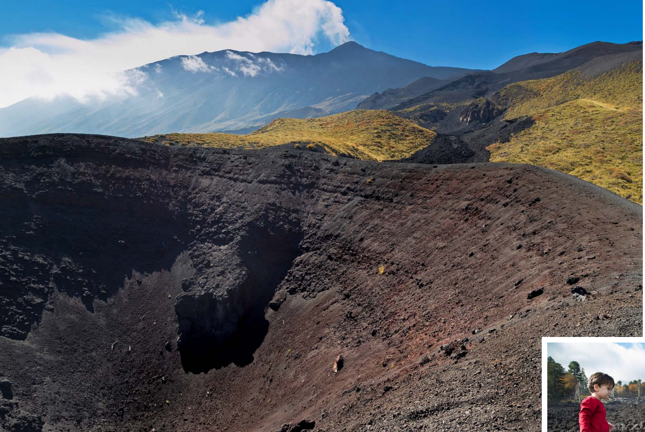
Punto di partenza delle gite sull'Etna, è lo Chalet Clan dei Ragazzi, situato a 1.500 metri nella pineta di Ragabo, una foresta magica con alberi secolari