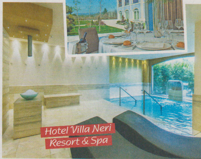
Hotel Villa Neri Resort & Spa

Alle pendici dell'Etna c'è un luogo dove i prodotti di questa terra si trasformano in ingredienti magici usati per rigenerare sia il fisico, sia la mente. Si tratta dell' Hotel Villa Neri Resort & Spa ( www.hotelvillaneri.it ) di Linguaglossa, in provincia di Catania. All'interno di questa struttura, infatti, sorge Petra Spa, dove trovano ampio uso estratti di piante locali, olio d'oliva, sale marino, mosti d'uva dell'Etna, spezie e agrumi.