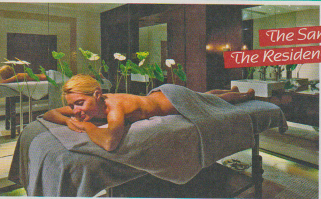
The Sanctuary The Residence Mauritius

Passando dalla sauna al bagno turco, dalla piscina riscaldata con idromassaggio alla doccia emozionale, dalla fontana di ghiaccio alla zona relax con i lettini ad acqua, il percorso benessere della Spa regala un'intensa esperienza sensoriale, per una remise en forme all'insegna della dolcezza. Sono infine disponibili trattamenti viso, corpo e viso-corpo e vari massaggi, compresi quello riservati alle future mamme, agli sportivi e quelli con l'uso di pietre calde.