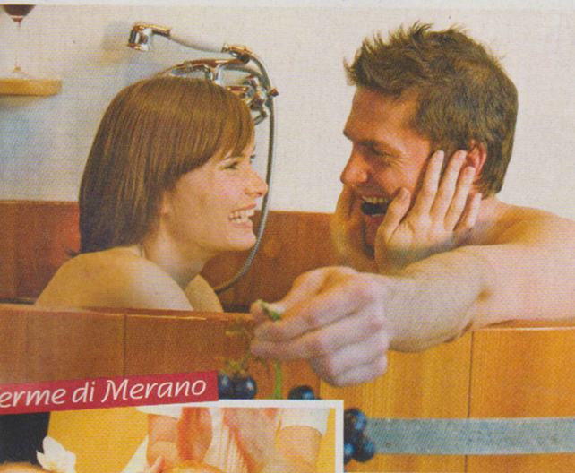
erme di Merano