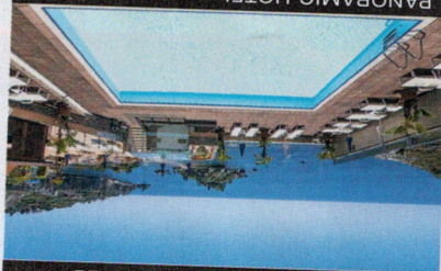
SAN DOMENICO PALACE HOTEL