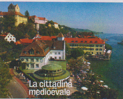
La cittadina medievale