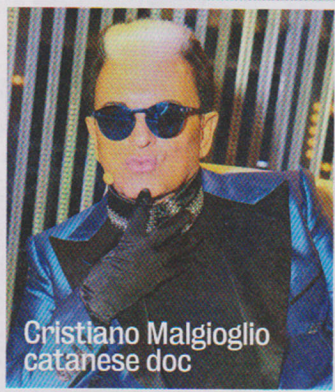
Cristiano Malgioglio catanese doc

I l Sud, con la bella stagione che arriva prima, è l'ideale per assaggiare un anticipo d'estate. L'Hotel Villa Neri Resort e Spa di Linguaglossa (Ct) lancia la sua proposta che premia con offerte straordinarie chi sceglie maggio per concedersi una pausa. La proposta del resort a cinque stelle, tra le colline alle pendici dell'Etna, include due pernottamenti con prima colazione, la cena il giorno dell'arrivo e il pranzo il giorno seguente al ristorante Dodi Fontane , a 320 € a persona nel weekend e festivi e a 256 € in settimana. Nel prezzo anche un percorso benessere nella Petra Spa, un massaggio total body e un massaggio a scelta. A disposizione degli ospiti la piscina esterna per bagni rinfrescanti e tintarella, oltre al silenzio del luogo e all'inebriante profumo della primavera. Info: www.hotel-villanerietna.com .