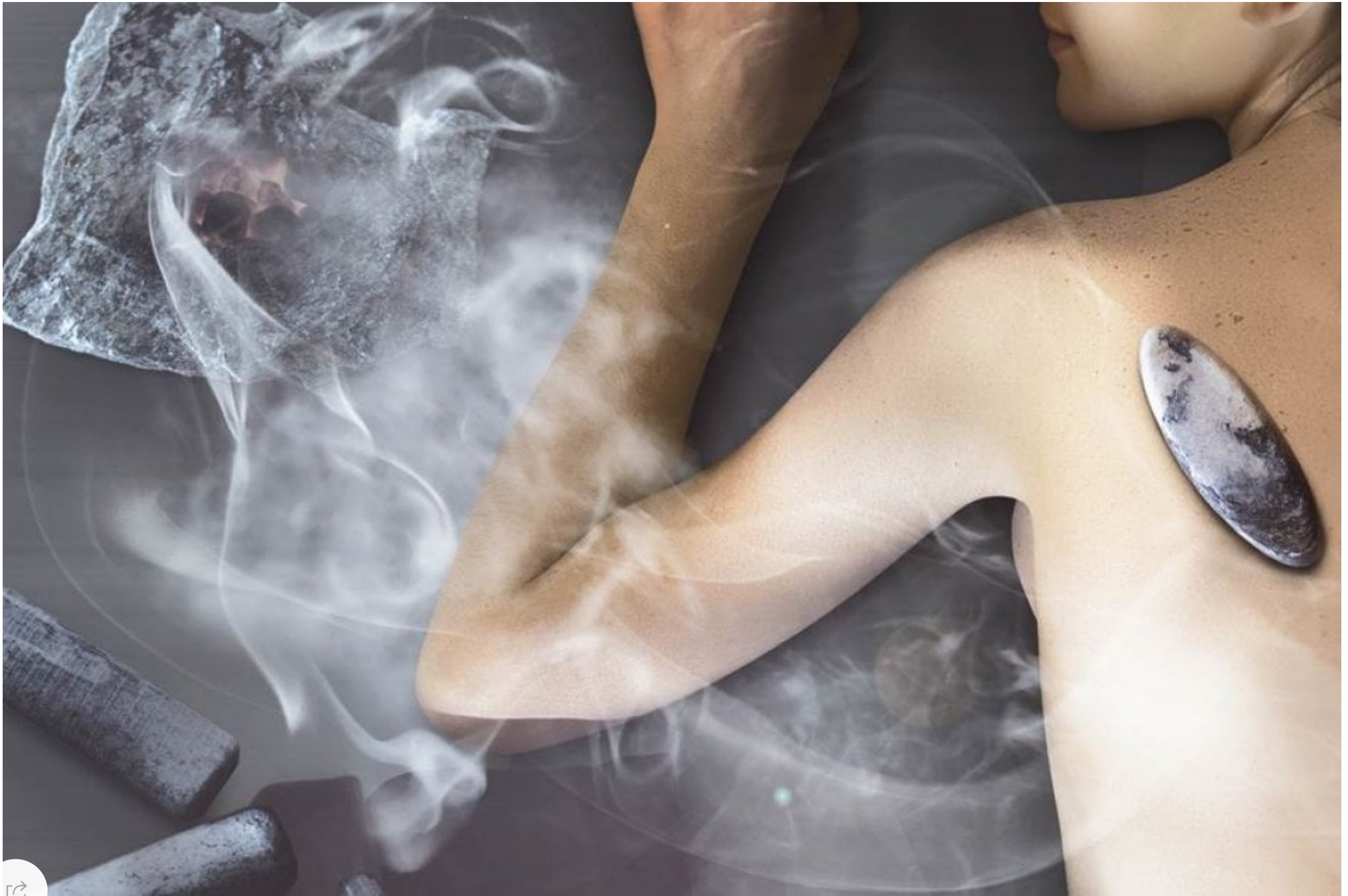
Vigilius Mountain Spa, massaggio con pietra primordiale o quarzite argentea