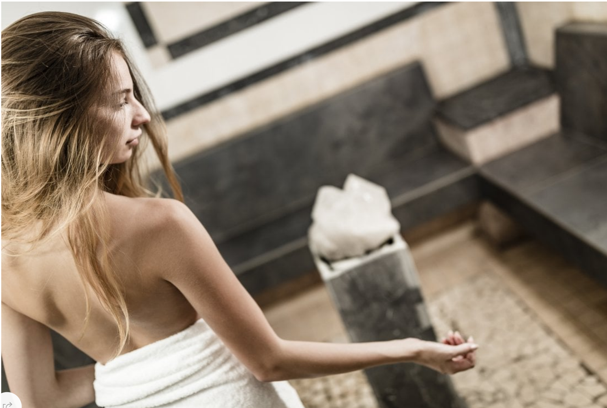
Josep Spa: il trattamento con cristalli con azione riequilibrante per viso e corpo