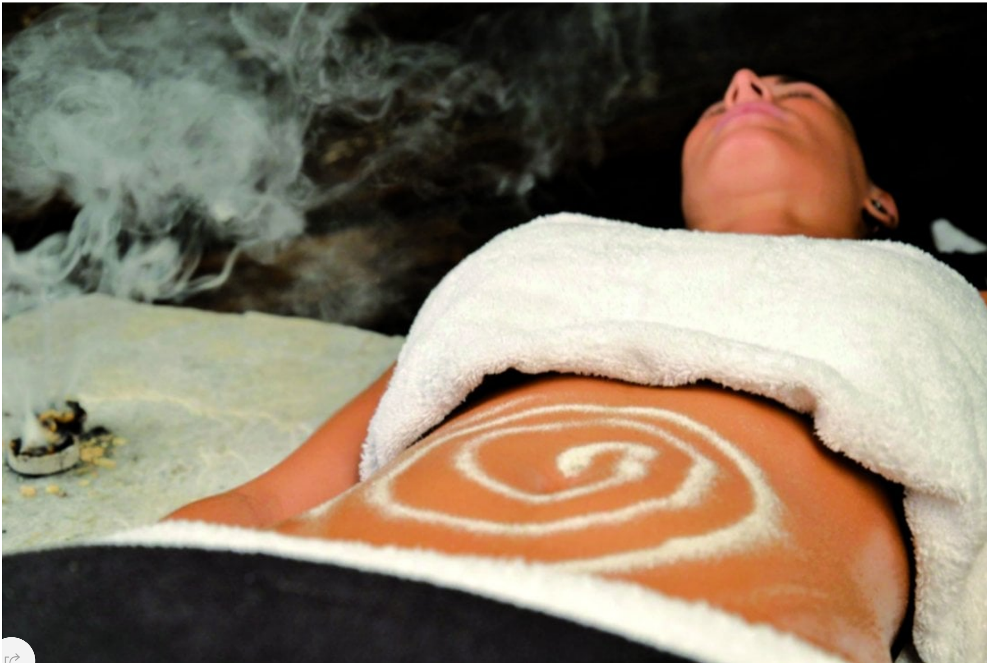
Hotel Pfoesl, trattamento con polvere di zeolite per rassodare e disintossicare