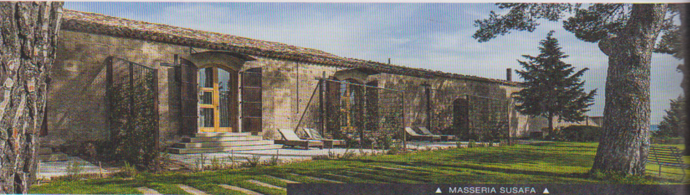
▲ MASSERIA SUSAFÀ ▲