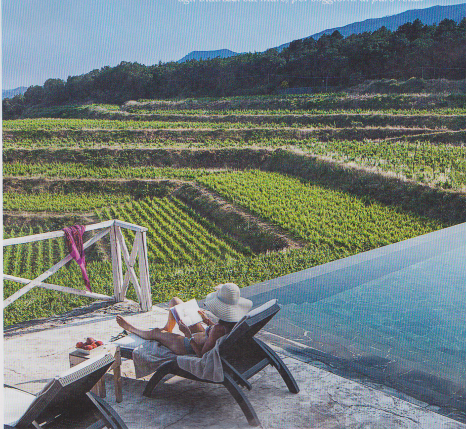
Nella foto. Sembra sospesa tra le vigne la piscina a sfioro del wine resort e tenuta vinicola Barone di Villagrande.

Aziende vinicole trasformate in hotel di charme e dimore con piscina nell'entroterra sono un'alternativa agli indirizzi sul mare, per soggiorni di puro relax