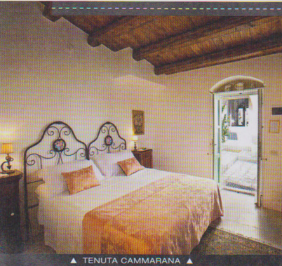
▲ TENUTA CAMMARANA ▲