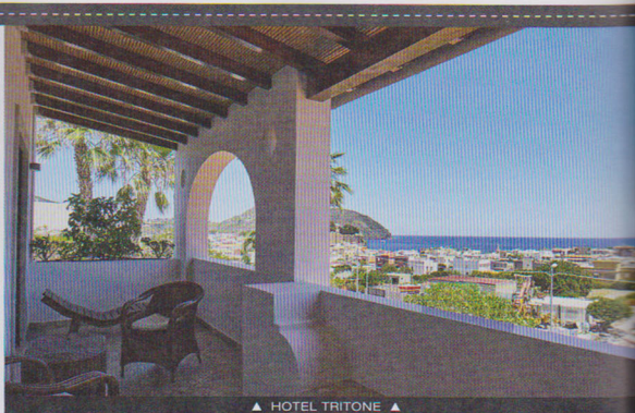
▲ HOTEL TRITONE ▲