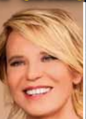
MARIA DE FILIPPI