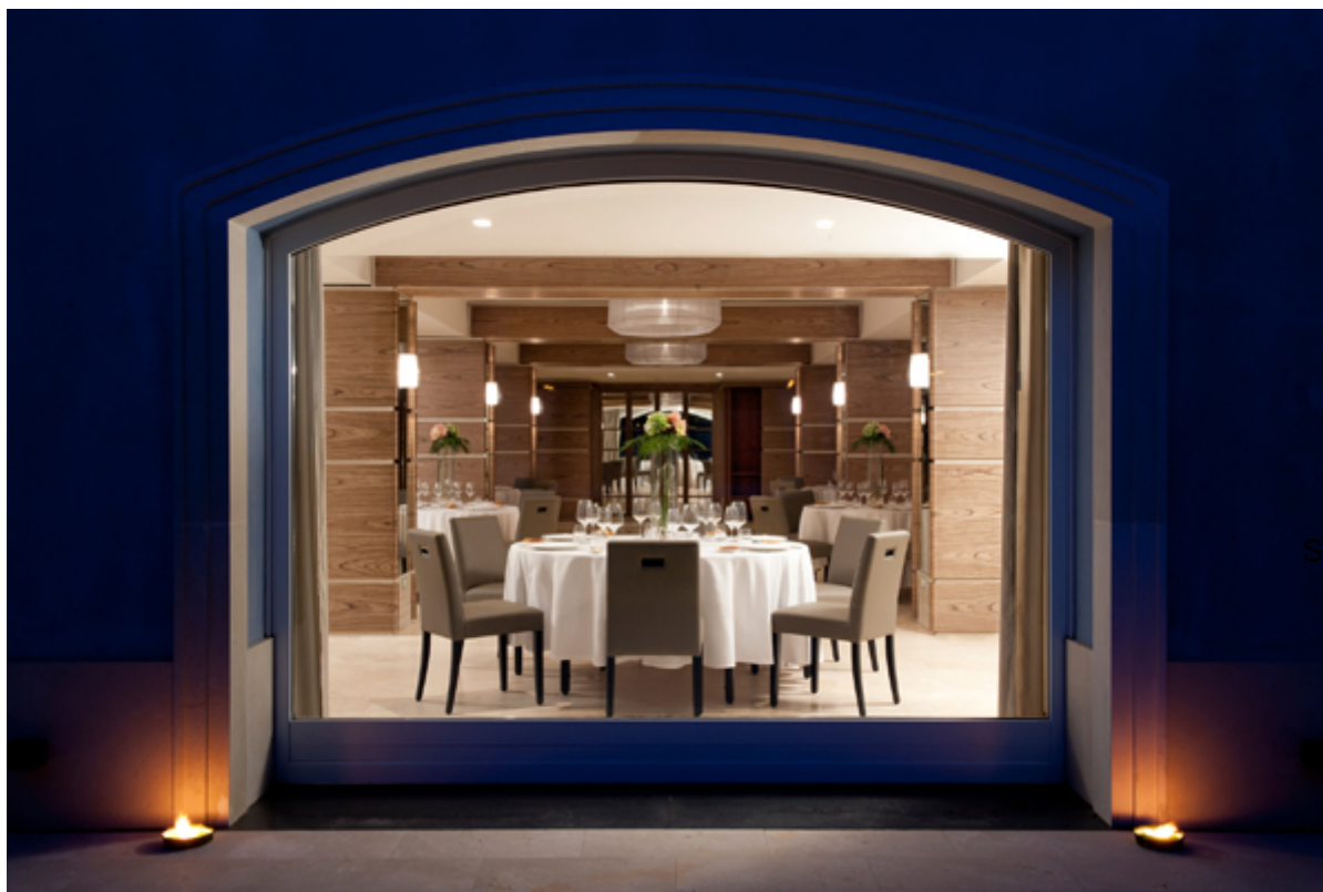
Hotel Villa Neri Resort &amp; Spa , cena al ristorante